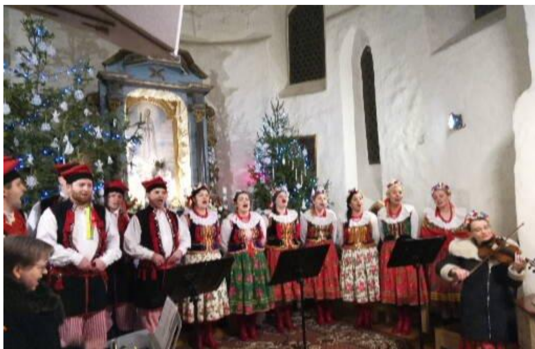
Wspólne kolędowanie z zespołem „Bierutowianie Bis”, styczeń 2019 r.