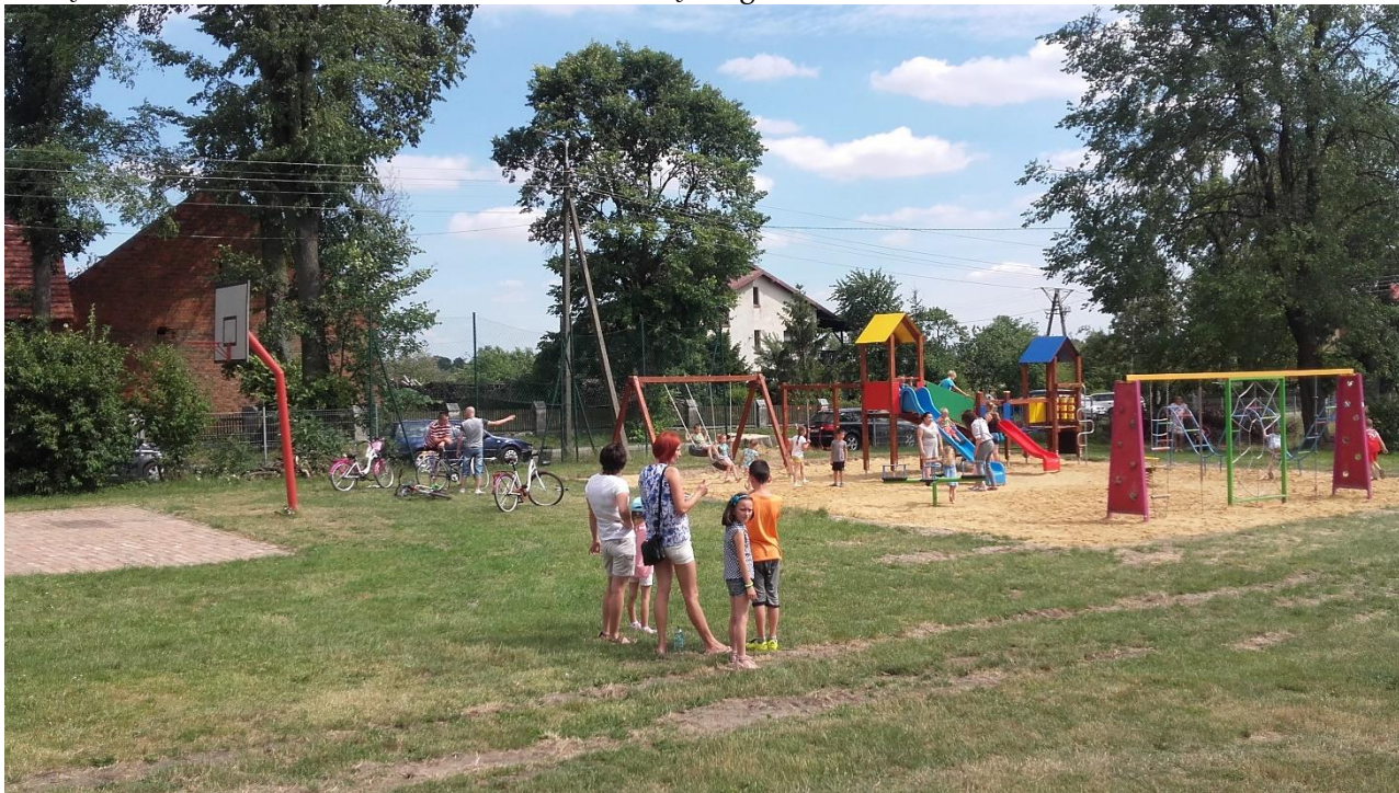
Otwarcie placu zabaw po modernizacji, 2016 r.