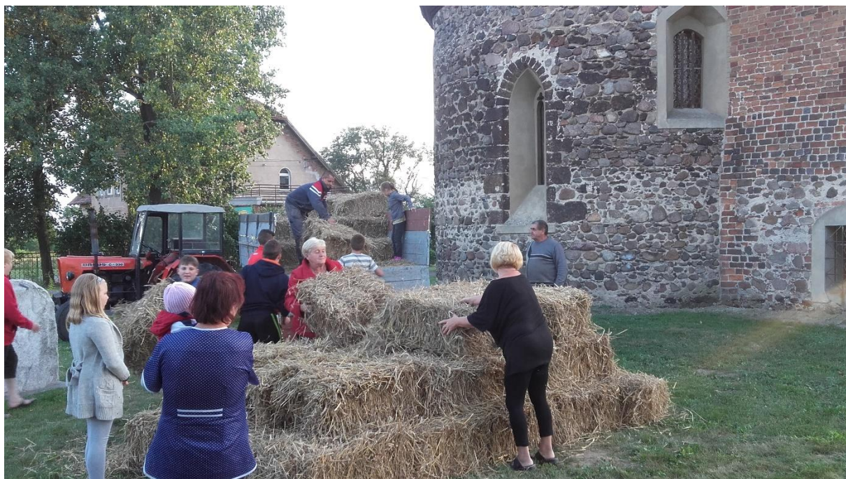
Ubieranie placu przykościelnego na dożynki sołeckie, sierpień 2016 r.