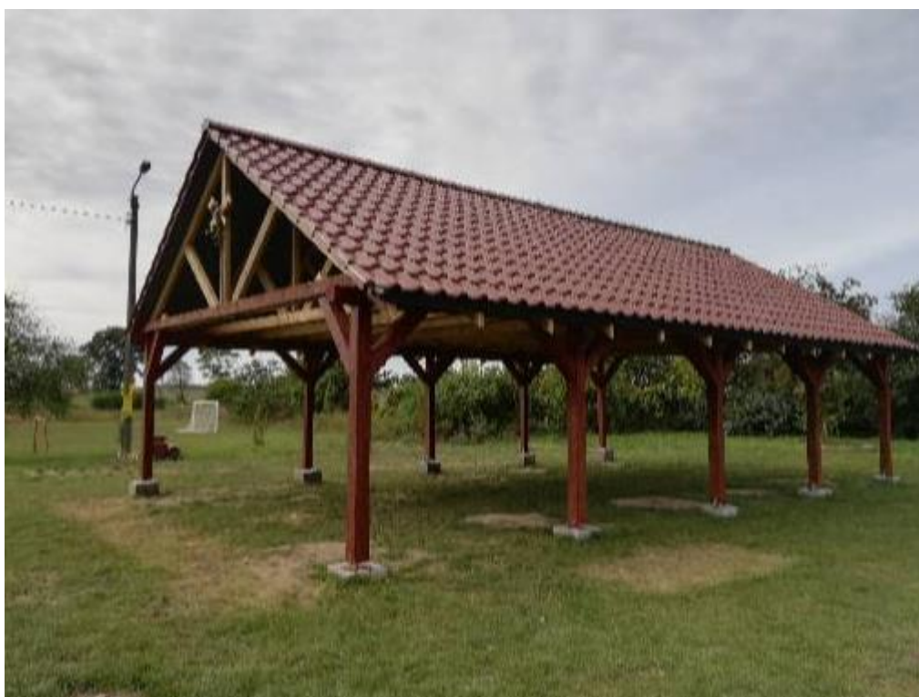
Wiata rekreacyjna, 2018 r.