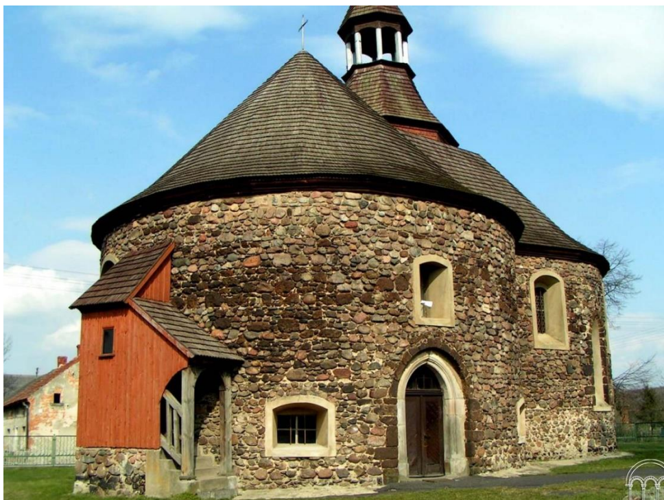
Kościół p.w. Narodzenia NMP w Stroni. Rotunda późnoromańska z elementami wczesnogotyckimi, XIII w.