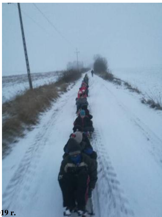
Kulig, 2019 r.