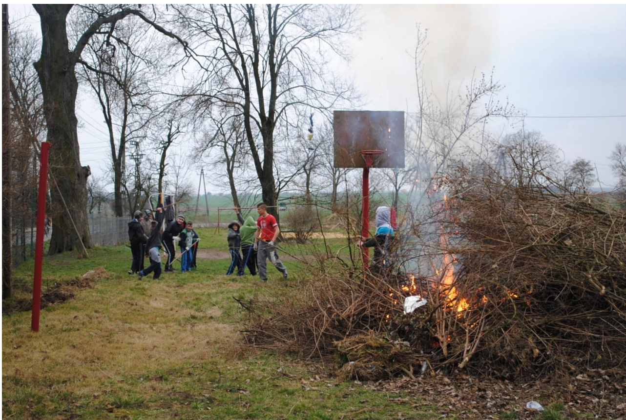
Coroczne wiosenne porządki