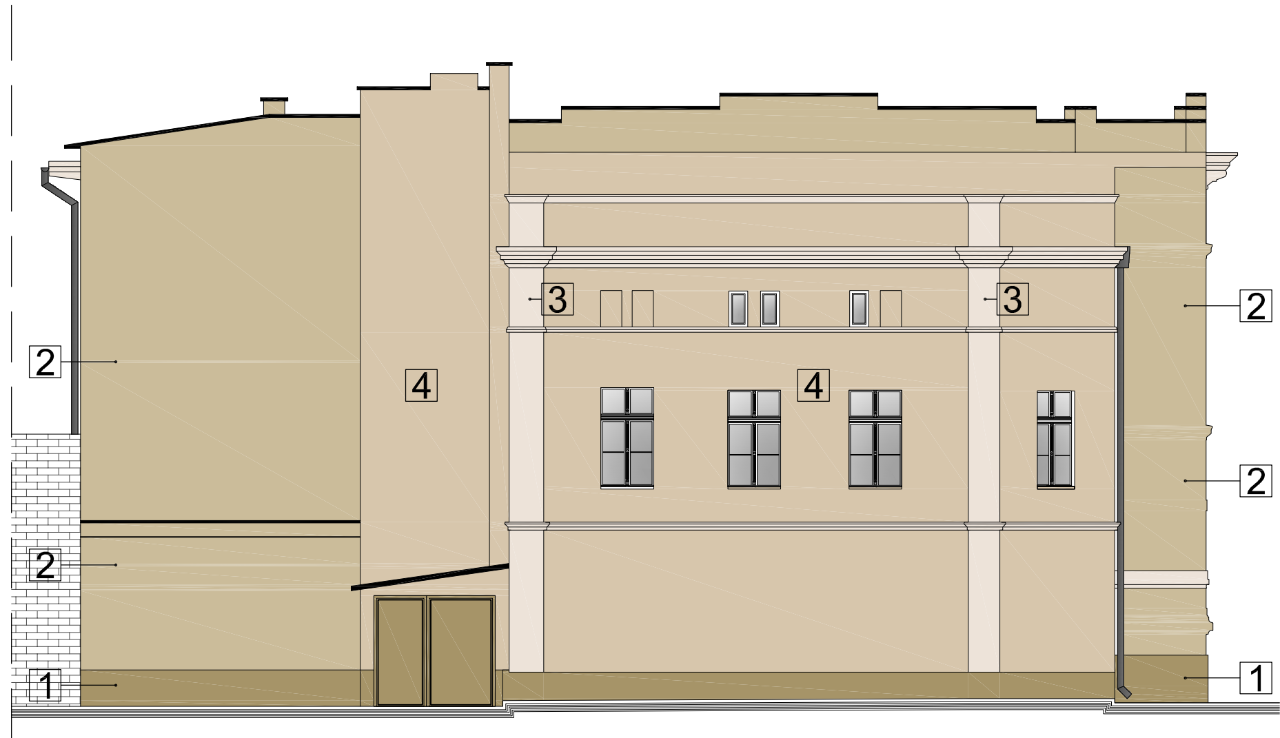
BUDYNEK B WIDOK NR 7