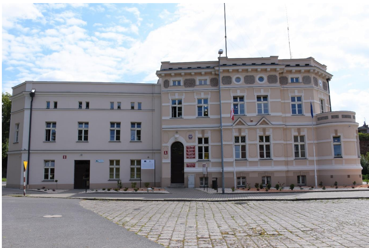
Rysunek 1. Urząd Miejski w Bierutowie