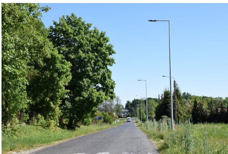
Rysunek 6. Budowa oświetlenia drogowego w miejscowości Karwiniec

Inwestycja dotycząca drugiego etapu rozbudowy oświetlenia drogowego w Karwińcu wzdłuż odcinka drogi powiatowej nr 1536D, długość odcinka linii 900 m, 19 punktów oświetlenia drogowego. Zadanie wykonane przez firmę Handlowo-Uslugową „MIKAR” Miłosz Ruszel z siedzibą przy ul. Chopina 5/1, 56-400 Oleśnica. Zadanie dotowane przez Stowarzyszenie Aglomeracja Wroclawska w kwocie 75.000,00 zł brutto.