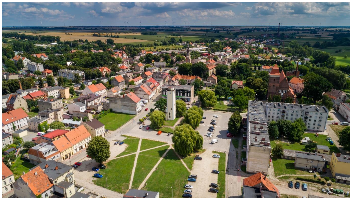
Rysunek 3. Rynek w Bierutowie