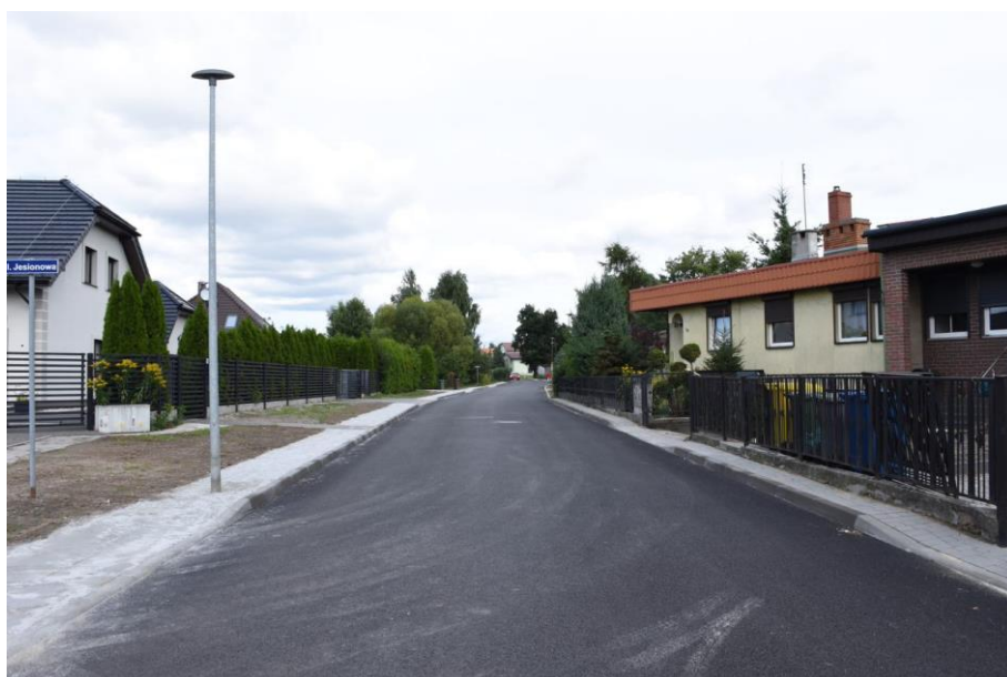
Rysunek 14. Remont ul. Wodnej w Bierutowie