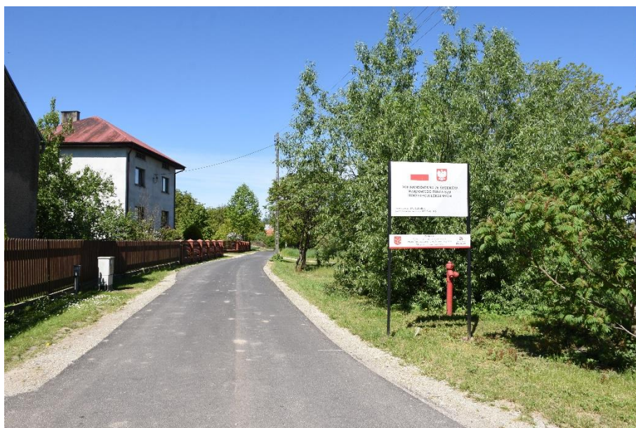
Rysunek 11. Modernizacja drogi gminnej w Jemielnej