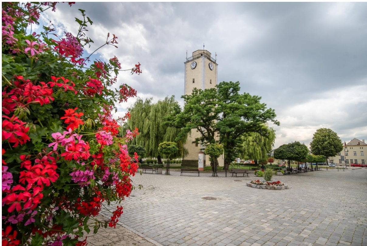
Rysunek 4. Wieża Ratuszowa w Bierutowie