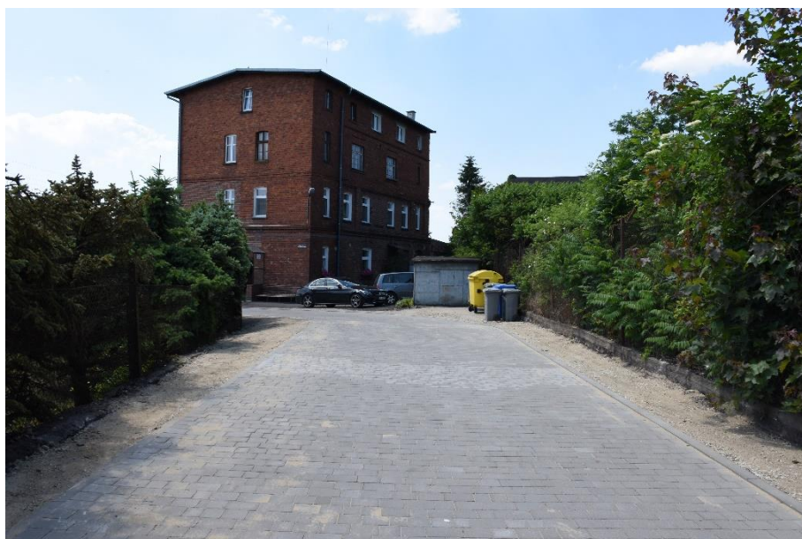
Rysunek 13. Modernizacja drogi gminnej w Bierutowie, ul. Kilińskiego