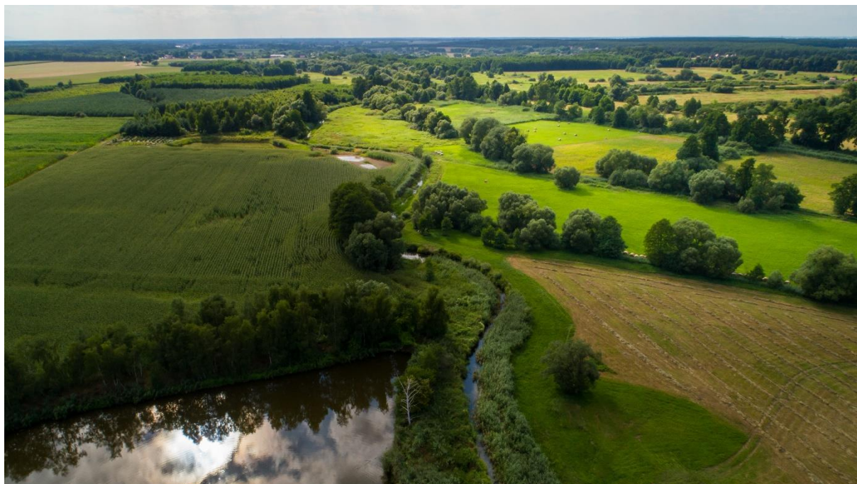
Rysunek 5. Gmina Bierutów