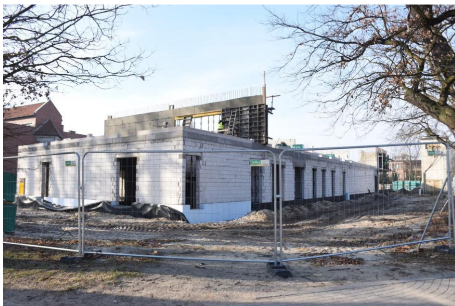
Rysunek 10. Budowa Przedszkola Miejskiego