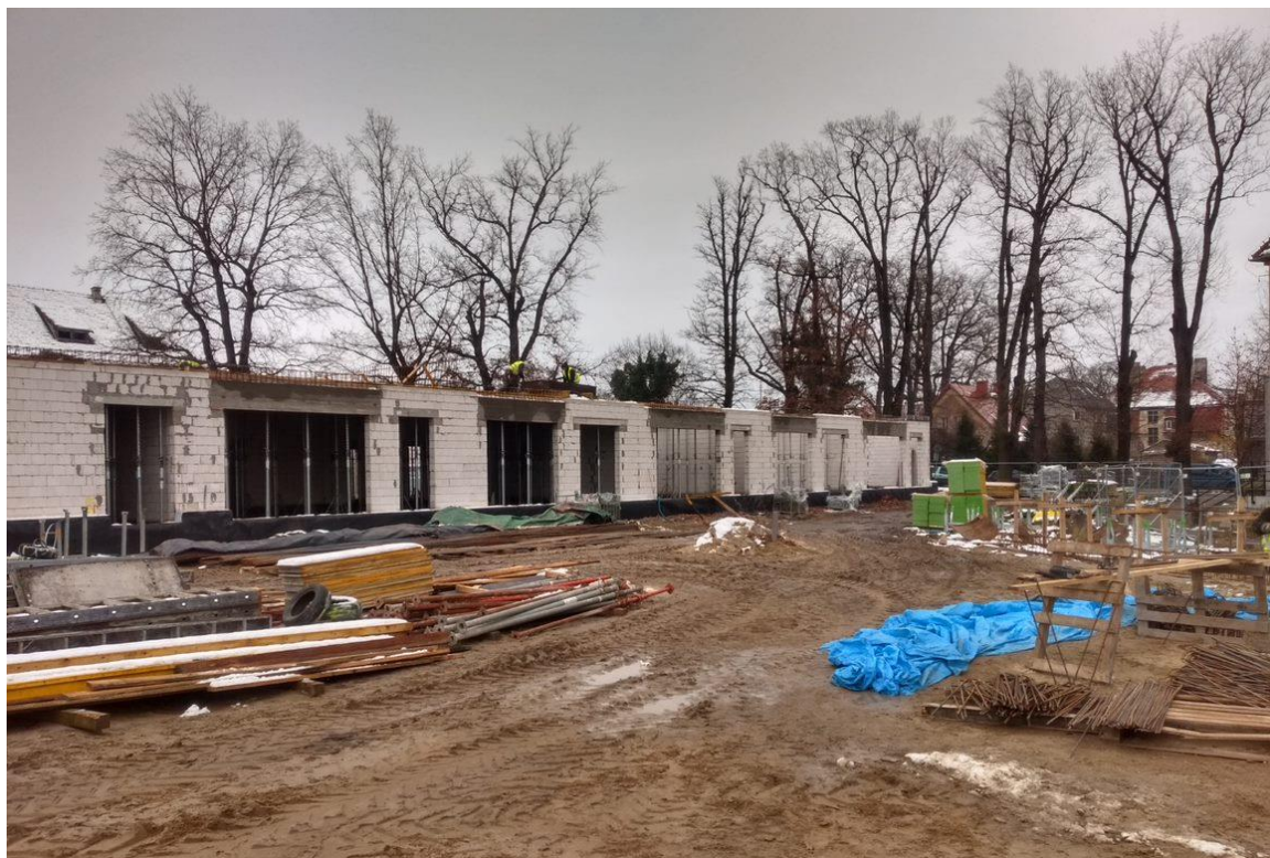
Rysunek 8. Budowa Przedszkola Miejskiego