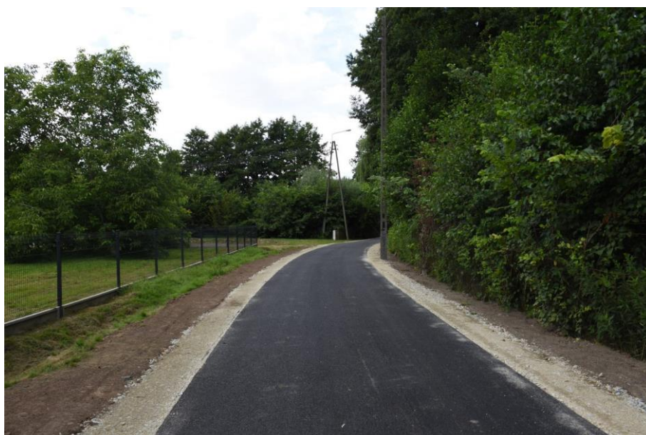
Rysunek 12. Modernizacja drogi gminnej w Jemielnej