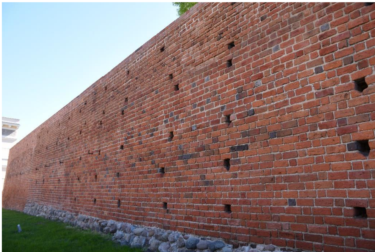
Rysunek 7. Rewitalizacja odcinka murów obronnych

dofinansowanie prac konserwatorskich, restauratorskich lub robót budowlanych przy zabytku wpisanym do rejestru zabytków z Ministerstwa Kultury i Ochrony Zabytków w ramach programu "Ochrona zabytków 2020" oraz "Ochrona zabytków 2021" a także z Urzędu Marszałkowskiego Województwa Dolnośląskiego w ramach naboru wniosków w roku 2021, dotyczących udzielenia dotacji na prace konserwatorskie, restauratorskie lub roboty budowlane przy zabytkach wpisanych do rejestru zabytków.